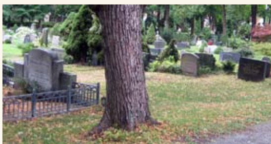
Bragernes øvre kirkegård.