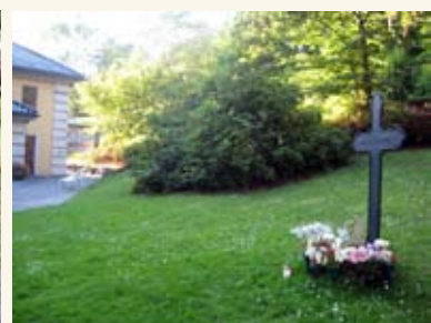
Gravminne ved krematoriet for anonymt gravlagte.