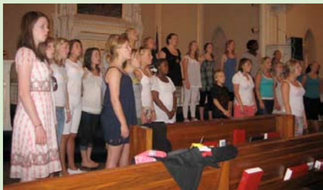
Ungdomskoret med korøvelse i "First Lutheran Church, Decora".

Alle var svært forventningsfulle og gledet seg til en uke med nye og store opplevelser.