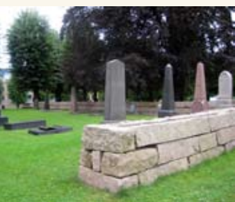
Bragernes nedre kirkegård.

Bragernes kirkegård har også et annet navn, "Bragernes øvre kirkegård"; dette tilsier at det også finnes en "Bragernes nedre kirkegård". Denne befinner seg ved Losjeplassen, i det som betegnende nok kalles Kirkegårdsparken. Denne kirkegården ble anlagt i 1853 med tanke på koleraepidemier, som herjet nedover i Europa på den tiden. Siste gang kirkegården var i bruk var i 1952. Nå er området blitt park, men fortsatt står det noen gravstøtter i det ene hjørnet, som minner om fordums bruk av området.